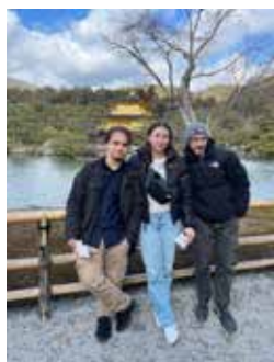
◆金閣寺にて姉兄と

lesson on grammar or specific practice for an exam. So, most of the time one lesson doesn't look like the other! This program has been a great experience in my teaching studies by making me practice a completely different way of teaching. On top of that it also helped me improve my Japanese. One on one tutoring is also a great opportunity for the tutees, as it allows the tutees to discuss more laid-back topics. It makes it easier for them to try and talk in a foreign language as they are more willing to speak about their interests than any other random topic.